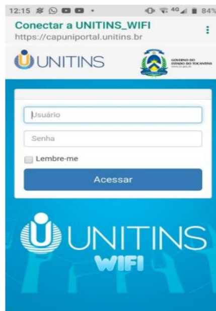
Figura 4. Autenticador WIFI

A Diretoria de Tecnologia da Informação – DTI da Unitins – TO planeja e gerencia recursos de hardware e software que permitam o alcance das diretrizes estratégicas da Instituição, em consonância com o prescrito na Política de Tecnologia da Informação.