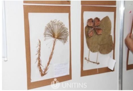
Acevo de Herbário HUTO em exposição: troncos de plantas fossilizadas (esquerda) e exsiccatas da flora nativa atual (direita).